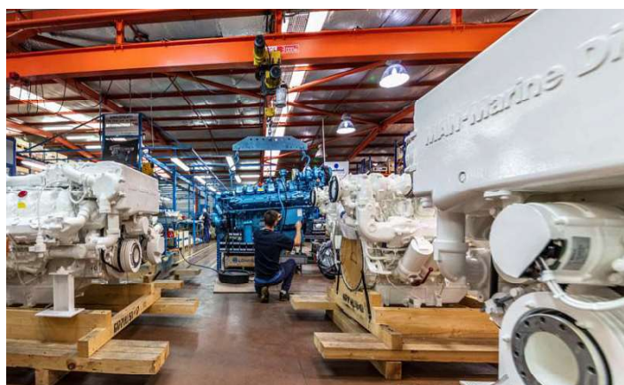
Nanni peut être amenée à réaliser des travaux spécifiques pour certains moteurs Man hors standard